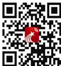
移动图书馆二维码