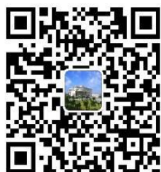
图书馆官方微信二维码